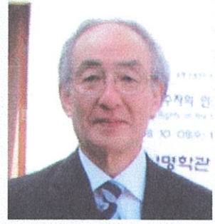
神奈川県立保健福祉大学名誉教授