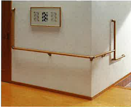
〈セット例〉合計価格 ¥34,200