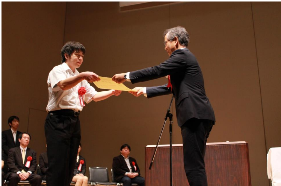
2 表彰式の様様 (大賞受賞 小規模多機能ホーム ななかまど)